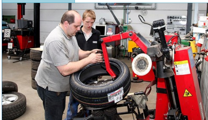
Naast de zaakvoerder, werken er ook nog twee vaste mecaniciens bij QTS