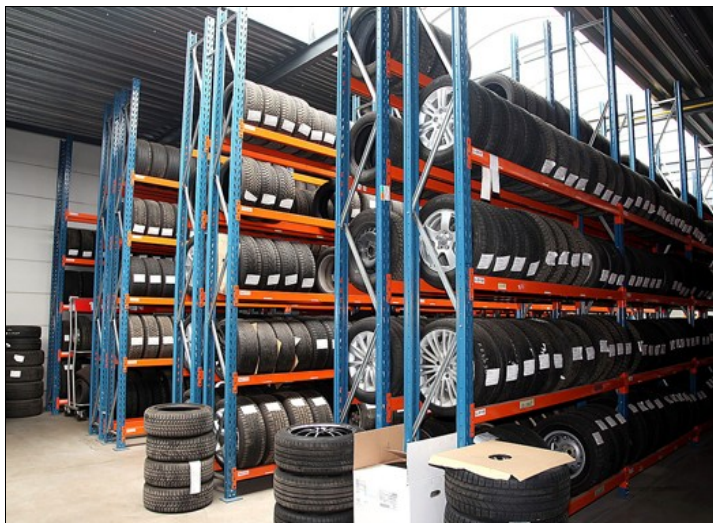
In het bandenhotel liggen de winter- of zomerbanden netjes gerangschikt en gelabeld te wachten op hun beurt om terug onder de auto gezet te worden