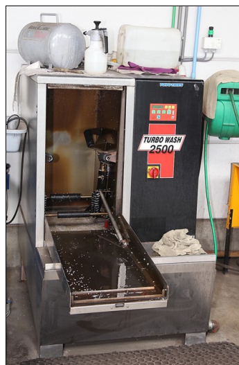
Het reinigen van de velg (in de Turbo Wash) maakt deel uit van de service