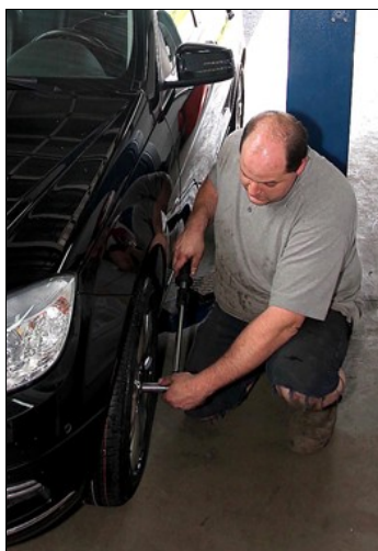
"Het aanspannen van de moeren volgens de juiste aanhaalmomenten is uiterst belangrijk."