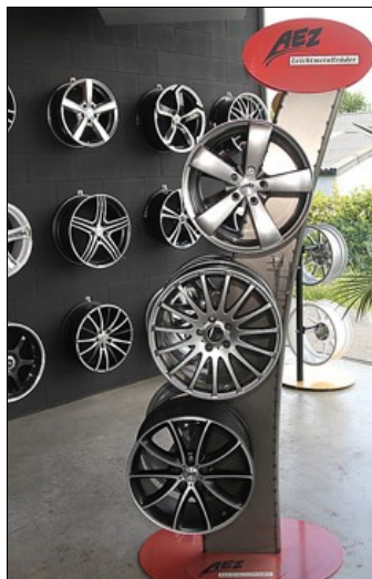
Ook velgen worden door QTS verkocht, bij voorkeur aluminium exemplaren